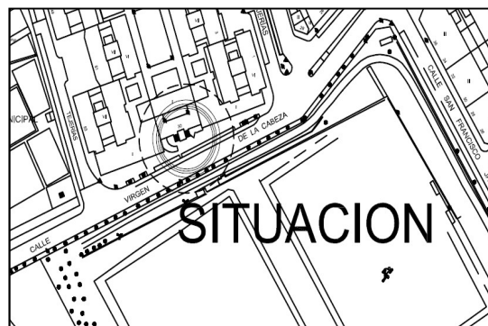
Ilustración 2 Plano de proyecto

2.- No se afecta en ningún momento la estructura de los edificios ni de los garajes, tanto es así que existiendo la posibilidad de adosar la rampa al muro del garaje, la memoria municipal plantea y así ha realizado un muro exento a cualquier edificación y por tanto no tienen siquiera dependencia estructural.